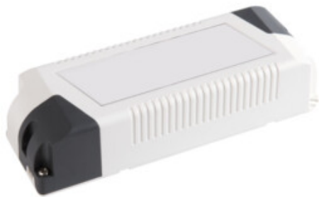
POWELED P 12V 30W